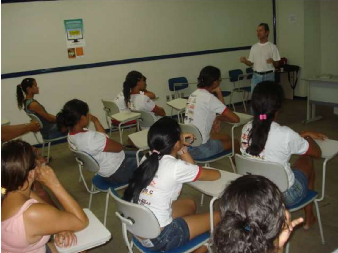
Curso de Ética e Cidadania