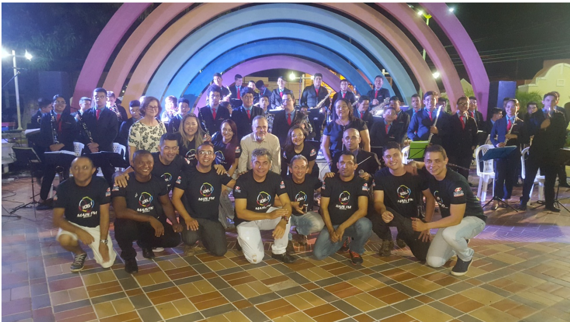
Para finalizar, um registro da equipe da Rádio Mais Fm e a Orquestra Filarmônica Estrelas da Serra