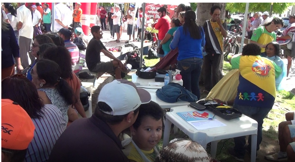
Programação especial do projeto Mais Ação; Na imagem, serviço gratuito de corte de cabelo ofertado através dos nossos parceiros