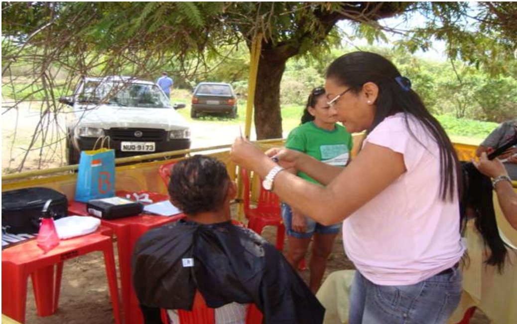
Serviços prestados à comunidade pelo SENAC e Voluntários da FAJI . Cortes de Cabelo