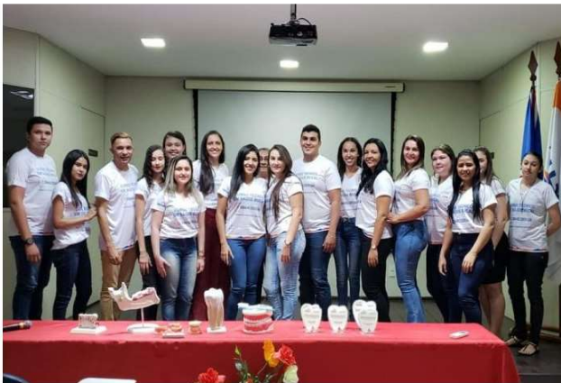
Um dos cursos que a FAJI possui participação é o de técnico em saúde bucal - Foto

A FAJI (Fundação de Apoio ao Jovem de Iguatu) e o Serviço Nacional de Aprendizagem Comercial – Senac firmaram convênio no início do segundo semestre no objetivo de somar forças enquanto agentes sociais no propósito de ofertar educação profissional voltado para o comércio de bens e serviços.