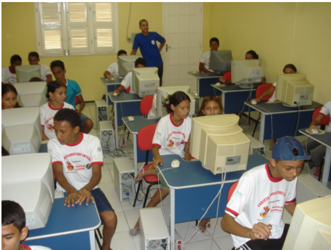
CURSO DE INFORMÁTICA

No final do curso cada participante recebeu um Kit, contendo todos os equipamentos para a iniciação dos seus negócios.