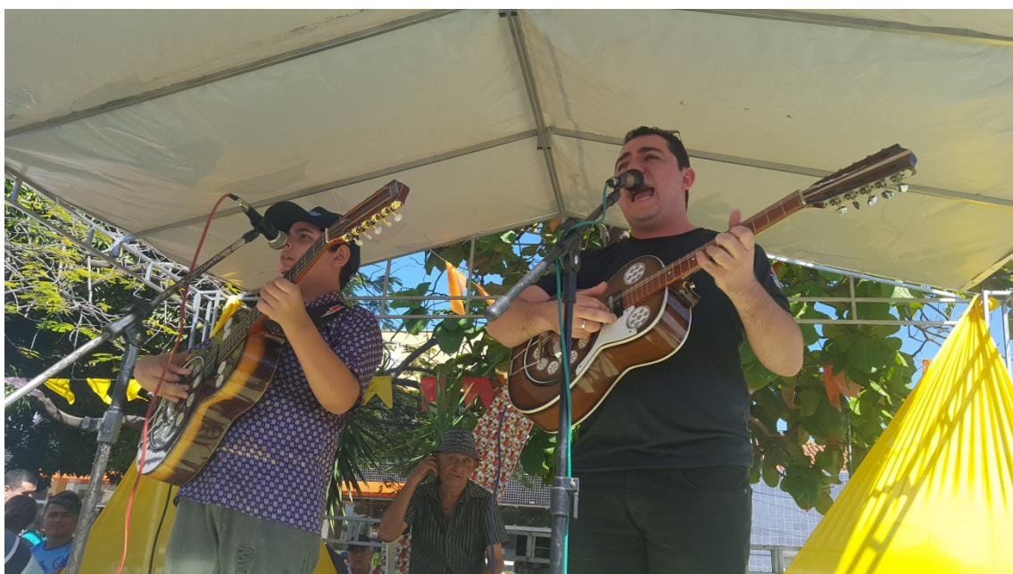
Violeiros subiram ao palco para abrilhantar ainda mais o evento