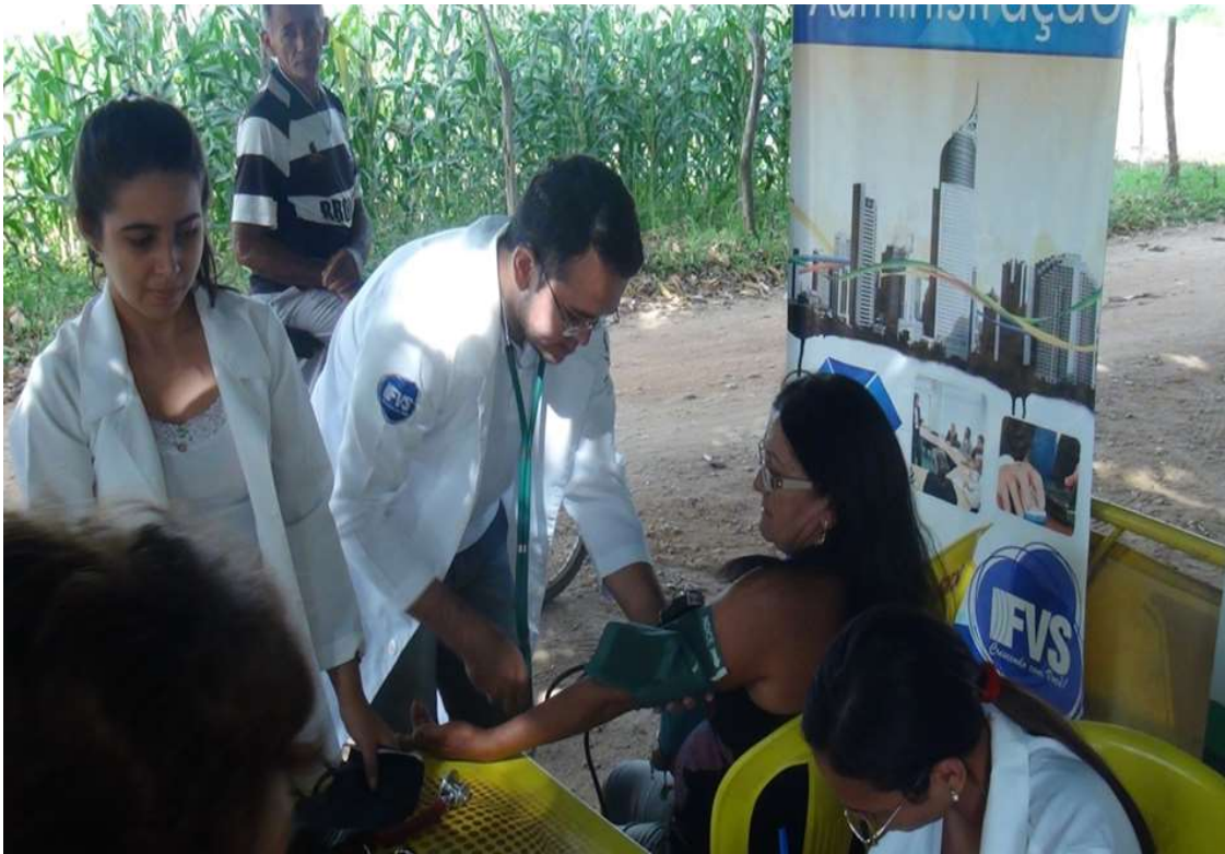
Aferição de pressão arterial e exames de glicemia