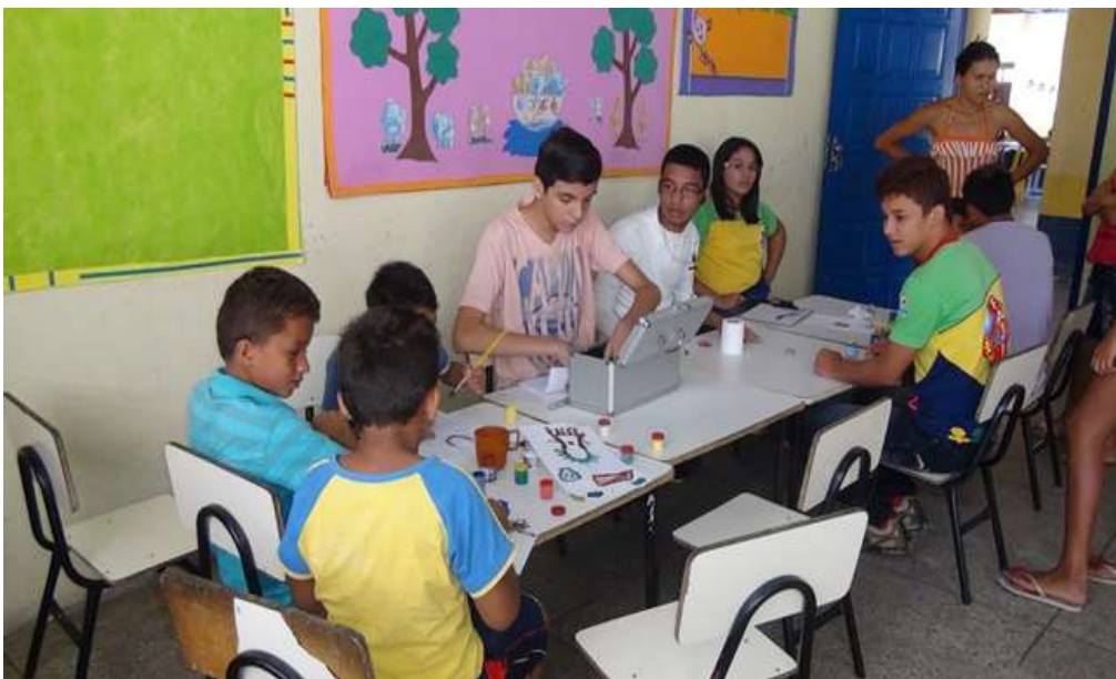
Oficina de Artes Plásticas