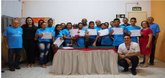
A entrega ocorreu na sede da escola Marista no Bairro João Paulo II.

Alunos de curso de informática são certificados pela FAJI e Escola Marista