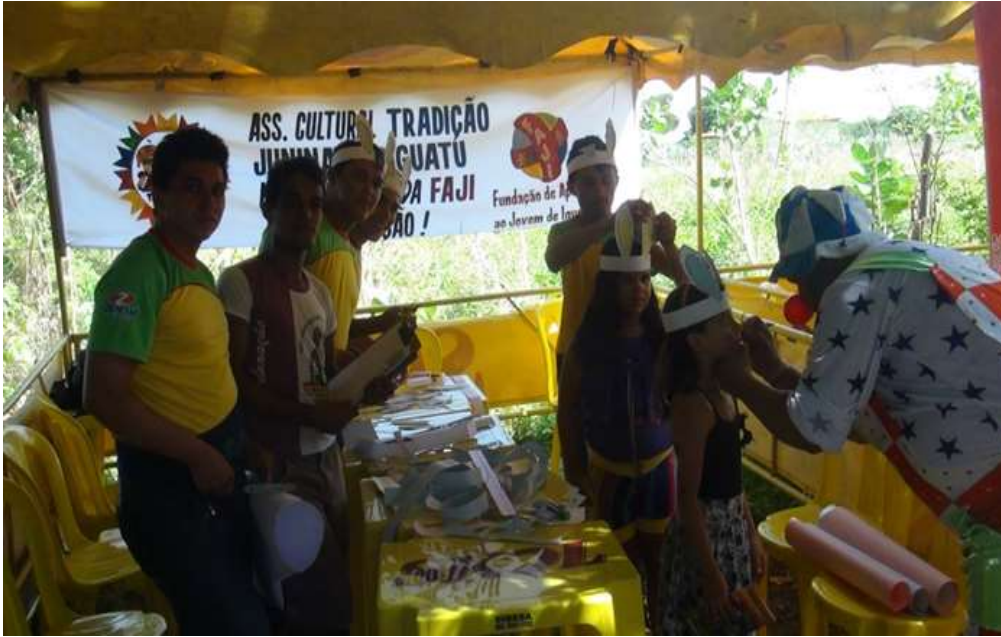
Oficina Festa Junina