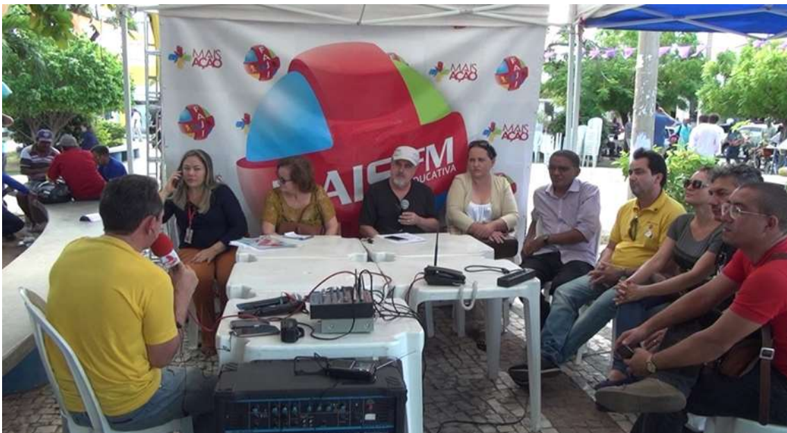
Edição Especial do Mais Ação, na comemoração dos 10 Anos da Rádio Educativa Mais FM - Junho/2017